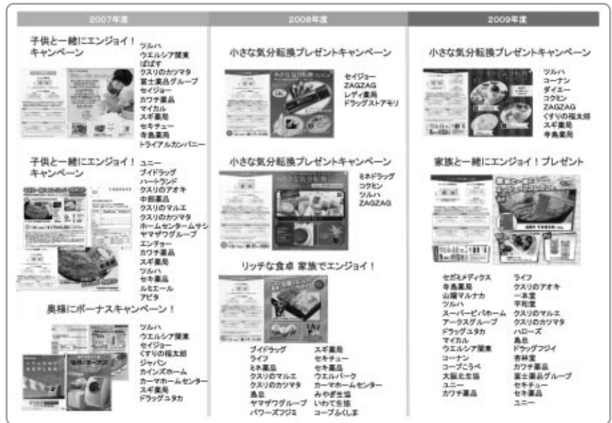
[図表3] 同一フォーマット キャンペーン実施メーカーランキング